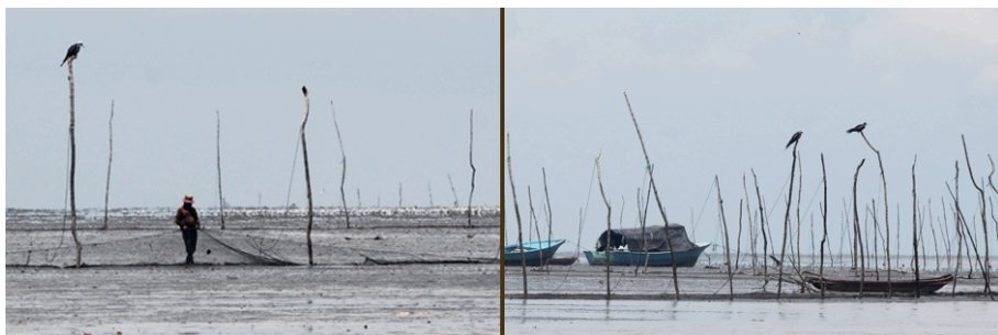
Tapes en bajos al este de la isla Puná. Fotos tomadas durante la bajamar.