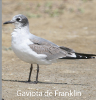
Gaviota de Franklin