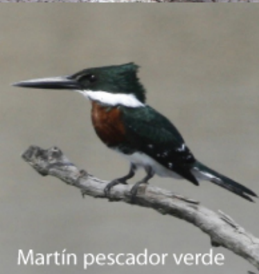
Martín pescador verde