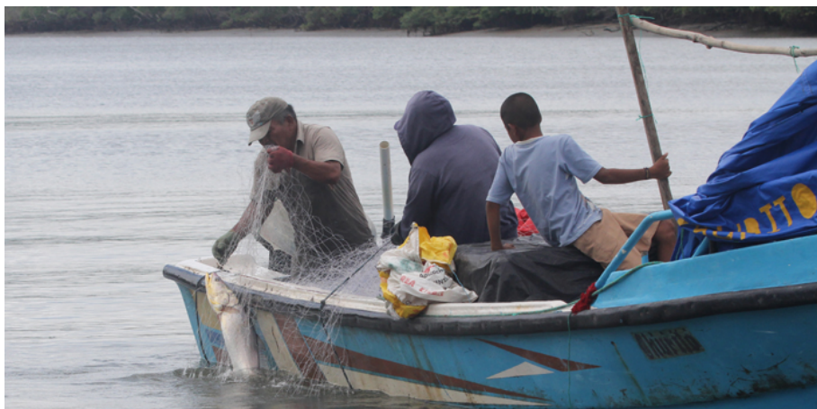
Redes de monofilamento de nylon colocado a lo ancho de los esteros constituyen una amenaza permanente para los delfines.

durante la marea alta para atrapar los peces que han entrado en la zona y al bajar la marea quedan atrapados en la red o varados sobre el banco de lodo. Es un arte de pesca poco selectiva que afecta indirectamente a los delfines al atrapar TODO lo que entra en estas trampas. Los delfines eventualmente pueden quedar atrapados cuando entran a estas zonas a cazar y después no pueden salir y se varan. Es necesario regular el ojo de malla y la extensión de los tapes, pues constituyen un verdadero atentado ecológico al capturar todo lo que entra incluyendo una gran cantidad de juveniles de muchas especies. Los tapes deberían ser prohibidos, pues se produce una gran cantidad de descarte, lo que afecta a también otras pesquerías.