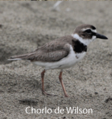
Chorlo de Wilson