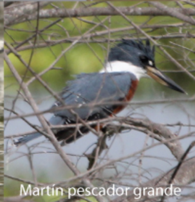
Martín pescador grande