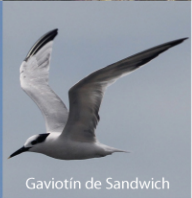
Gaviotín de Sandwich