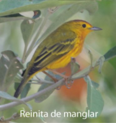
Reinita de manglar