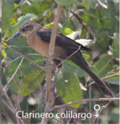
Clarinero colilargo ♀