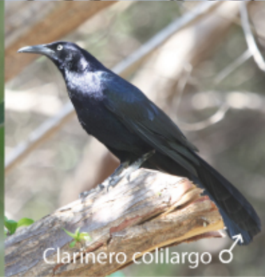
Clarinero colilargo ♂