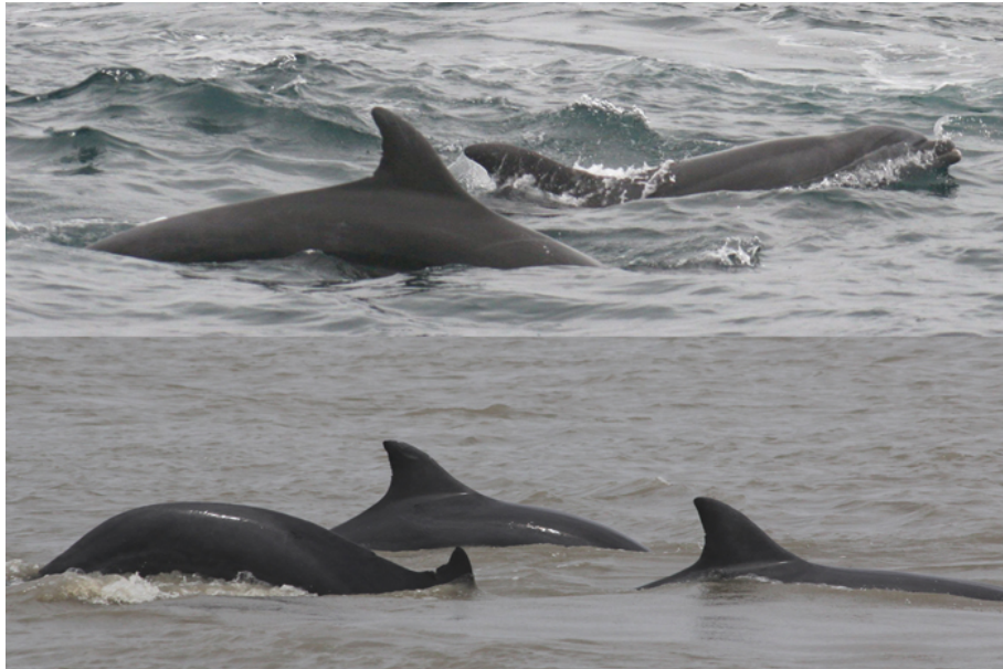
Bufoeos oceánicos (arriba) y costeros (abajo).

Existen al menos dos ecotipos de bufeos en Ecuador y en el mundo, uno costero y otro oceánico. Como su nombre lo indica, el costero es el que encontramos y a lo largo de la costa ecuatoriana y en aguas someras del golfo de Guayaquil. El ecotipo oceánico está mucho más extendido y en ocasiones puede estar bastante cerca de la costa también.