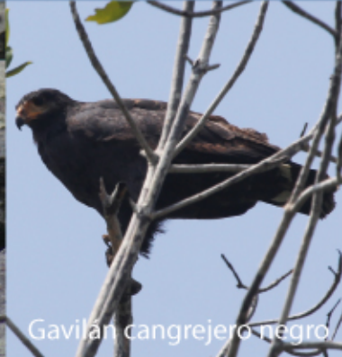
Gavilán cangrejero negro