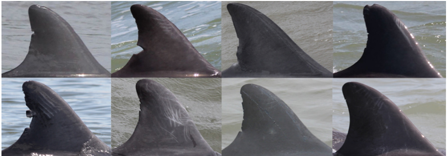
Aletas dorsales de bufeos fotografiados alrededor de Posorja y El Morro.

Si es posible. Para estudiarlos y hacer un seguimiento individual se utilizan marcas naturales como cicatrices, cortes en las aletas y pigmentaciones naturales o causadas por infecciones. La forma más común de reconocerlos es usando los cortes en el borde posterior de la aleta dorsal, pues es la parte más visible del animal y que se puede observar cada vez que viene a la superficie a respirar. Aunque parece una superficie muy pequeña para ser lo suficientemente variable como para permitir la individualización de un animal, se ha demostrado que gracias a los cortes en las aletas dorsales se pueden seguir a los individuos durante una década o más, por lo que se pueden considerar como una huella digital, de manera similar a la coloración única que presentan las ballenas jorobadas en la cara ventral de la cola. En el caso de los bufeos, las marcas naturales no son tan estables en el tiempo pues nuevos cortes van apareciendo enmascarando a los viejos.